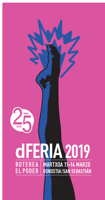
Cartel dFeria 2019