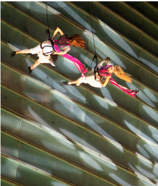
dFERIA, DENDU, Harrobi Dantza Bertikala Konpainia, Oreka TX