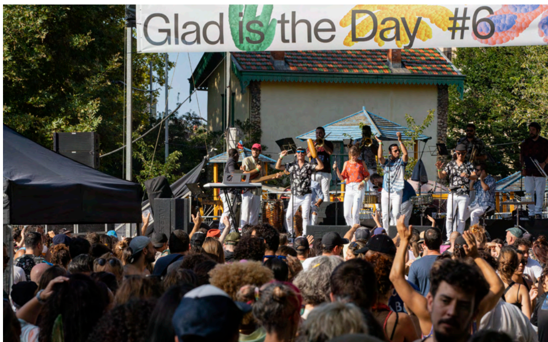
Glad is The Day, Goxuan Salsa